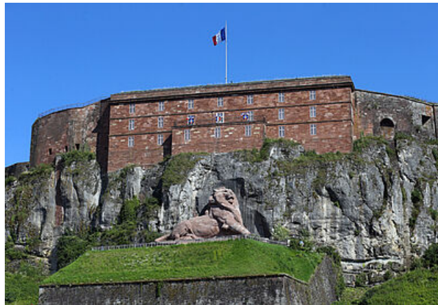
Lion et Citadelle de Belfort