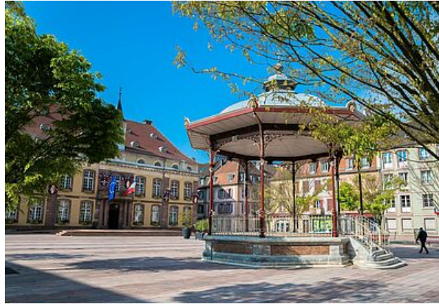
Kiosque à musique

Le marché Fréry vous ouvre ses portes tous les vendredis et samedis de 7 h à 12 h. Sous sa structure métallique aux parois vitrées, pas moins de 35 commerçants proposent spécialités franc-comtoises et alsaciennes. Viande, poisson, légumes, pains ou charcuterie, découvrez toutes sortes de mets sur les étals de ce marché emblématique, en lice pour l'élection du « Plus beau marché de France ».