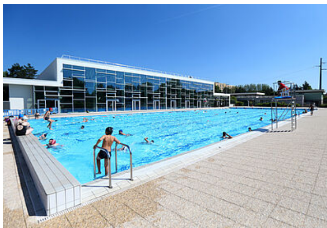
Piscine du Parc

Le gymnase Le Phare est le lieu de toutes les manifestations sportives belfortaines : matchs de l'équipe de handball de Belfort le BAUHB, gymnastique, équipe de France féminines de volley-ball, tournois de futsal (en hiver), judo, escrime, badminton, VTT trial, boxe (galas)... Il peut accueillir 1 500 personnes en tribunes.