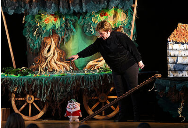
Théâtre des Marionnettes de Belfort

Le Théâtre des Marionnettes de Belfort crée et diffuse tout au long de l'année ses propres spectacles. Une centaine de représentations ont lieu chaque année, à destination des enfants et des adultes. Il est également possible de participer à des formations professionnelles, des colloques ou diverses manifestations culturelles. En février se tient le temps fort de ce théâtre : le Festival International de la Marionnette de Belfort.