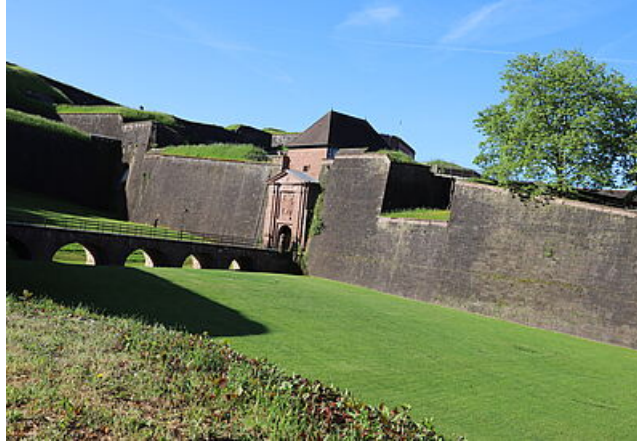
Porte de Brisach