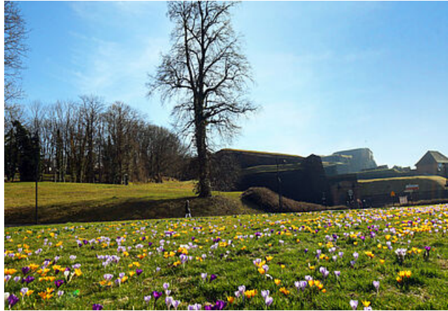
Citadelle de Belfort