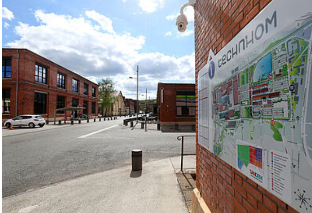
Vue sur le Techn'hom

Le Techn'hom est un parc d'attractivité économique et d'innovation industrielle où sont accueillies plus d'une centaine d'entreprises industrielles et bureaux d'études sur un périmètre de 110 hectares.