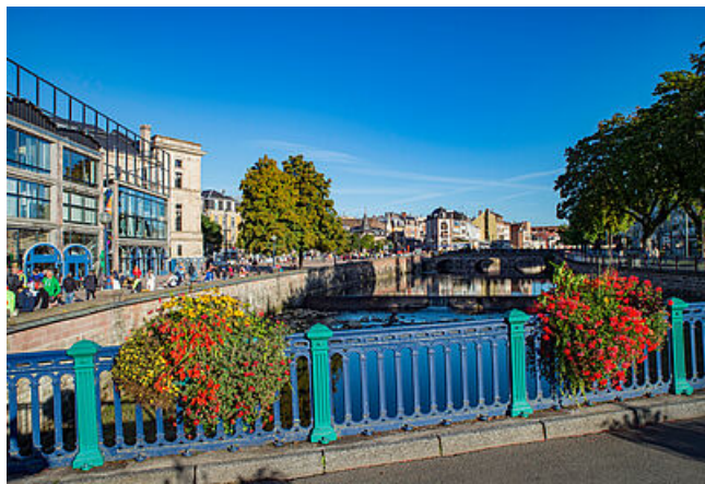
Le Granit au bord de la Savoureuse

Le Granit Scène Nationale est une salle accueillant pièces de théâtre, concerts de musique, danse, jeux du cirque ou encore expositions d'art. À la fois lieu de diffusion et de production, le Granit est situé dans un bâtiment proche du centre-ville, à quelques pas de la place Georges-Corbis.